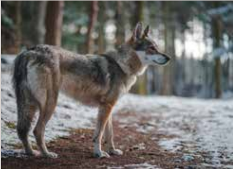
ARTENSCHUTZTAGE Wölfe (USA), Elefanten, Wald