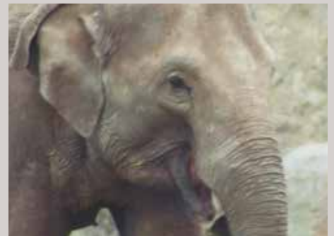
PERMANENT UNTERSTÜTZTE PROJEKTE