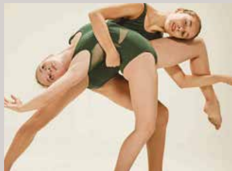
TANZ-PERFORMANCES mit Bezug zur Natur