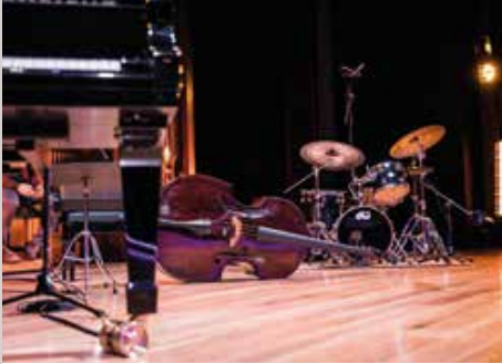
KLAVIERKONZERTE mit Orchester