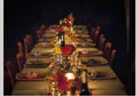
EXQUISITE MUSIK-DINNER mit führenden Musikern