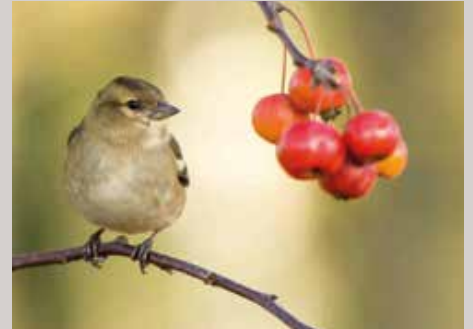
ARTENSCHUTZPROJEKTE auch Fundraising