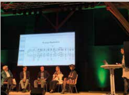
SYMPOSIEN PODIUM & PUBLIKUM zu Themen zwischen Natur und Musik