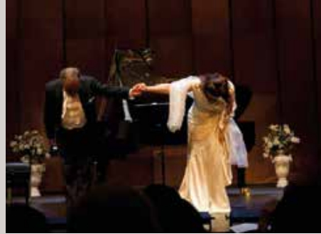
LIEDERABENDE mit Bezug zur Natur